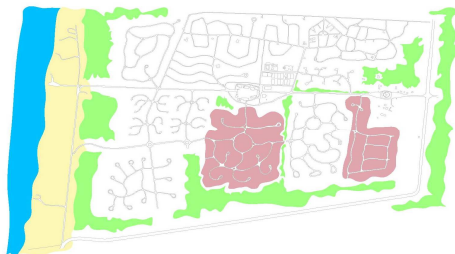
EUROPE & OCEANIE